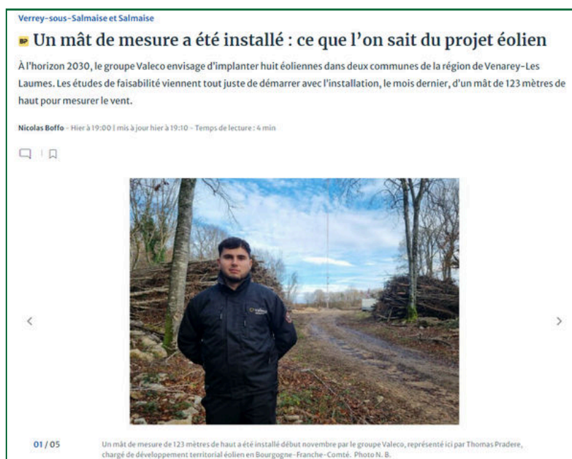
Article Le Bien Public - "Un mât de mesure a été installée : ce que l'on sait du projet éolien" 03/12/2024 Nicolas BOFFO