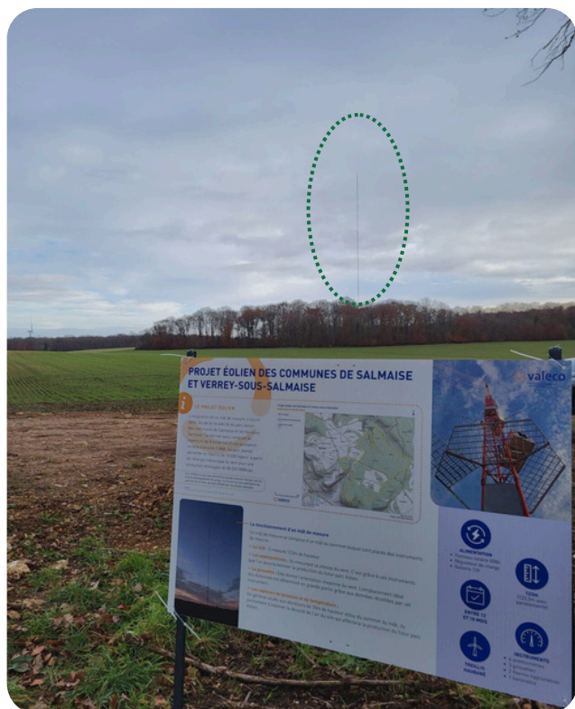
Panneau d'information mât de mesure Projet éolien de La Combe Roblot - 27/11/2024